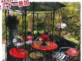
季節になるとバラでいっぱい!

定休日 水曜日 Instagram活用セミナー参加 営業時間 10:00~20:00 (完全予約制) (ランチ・ディナーは前日までにご予約で承ります。詳しくは、ホームページをご覧くださいませ。) 住所 加東市平木1310-912 きよみづ郷内 南通-7 電話・fax 078-585-6313