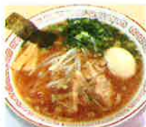
華ラーメン 800円(税込)