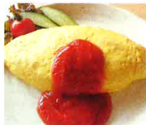
オムライス 【サラダ付】750円(税込)