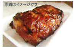
※店頭でお引き換えください

「 憐藤野精肉店 」の 「 焼豚(1,000円相当) 引換券 」を5名様に プレゼント!