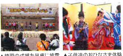
▲練習の成果を見事に披露 ▲子供達のおひなさま体験

10月27日、加東市秋のフェスティバルに「わくわくおひなさま体験」を開催。二八〇名の方に着付け体験を喜んでいただきました。また、ステージイベントにも出演し、まちかど体操の一環として行っている「トランプ体操」を披露しました。