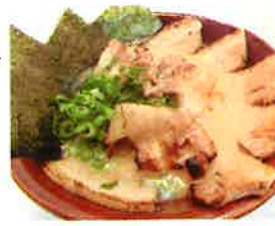
肉盛ラーメン 950円(税込)