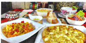
食用バラをちりばめたメニューも