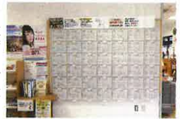
<道の駅とうじょう求人掲示板>

○ハローワークの求人票を「市役所1階ロビー」「Bio2階」「道の駅とうじょう」に掲示しています。また、「ミナクル(南山)」でも求人票ファイルの閲覧ができます。 ○就労支援室では、オンラインシステムで希望の求職先が検索できます。