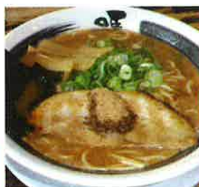
節嗎(ぶしうま) 810円(税込)