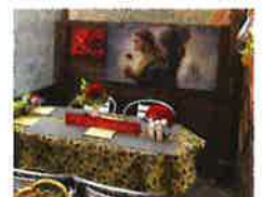
おしゃれな空間でおくつろぎください

加東市商工会は、「創業予定の方」、「創業に興味のある方」、「創業間もない方」をお手伝いします。 お気軽にご相談ください。 加東市商工会創業支援室 加東市社717-1 ☎(0795)42-0253