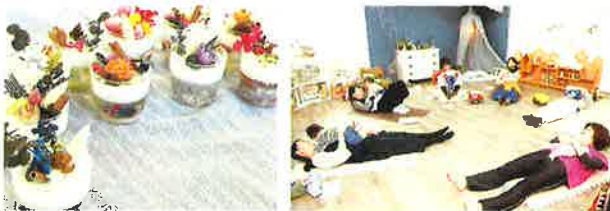
アロマワックスカップで癒しを 赤ちゃんと一緒にのベビーヨガ

平成29年の創業塾に参加して起業を決意し、商工会にサポートしていただきながら開業することが出来ました。