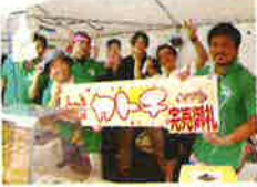
▲大好評の青年部ブース

8月1日、加東市花火大会(東条湖おもちゃ王国付近特設会場)にて、一般ブースや有料観覧席近くのブースで地域特産品の「播州ラーメン」&当日限定のポテトチップス「カトチ」を販売し、大盛況のうちに完売しました。