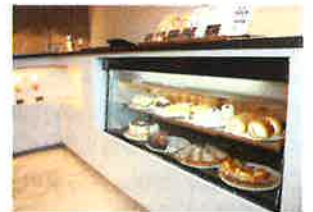
タルトやチーズケーキなどの生ケーキ