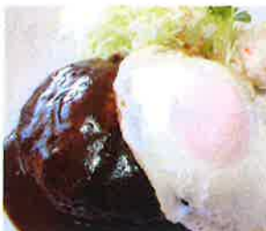
デミグラスソースハンバーグ 【ライス・みそ汁付】950円(税込)

商工会の創業塾で勉強させていただき又、店舗探しの際にも大変お世話になりました。おかげで無事に開業することが出来ました。