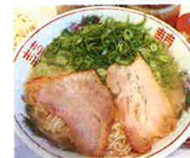
とんこつラーメン500円(税込)