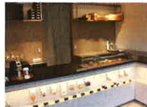
お洒落なディスプレイのクッキーとスコーン

生ケーキやスコーンなどの焼菓子、お菓子に合わせてスペシャルティコーヒーも。甘いもので楽しいお茶の時間のお手伝いが出来ればと思います。