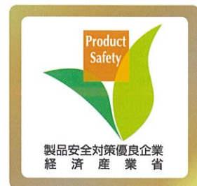
製品安全対策ゴールド企業 ロゴマーク