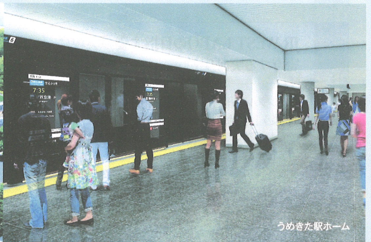
うめきた駅ホーム