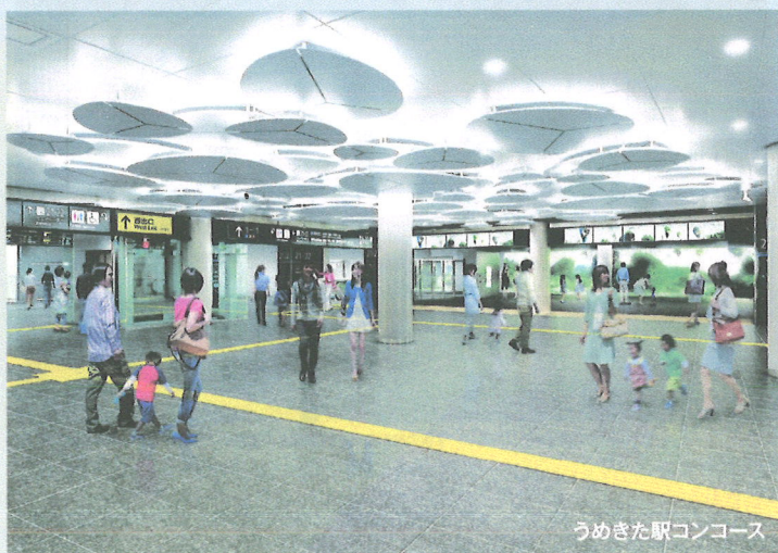
うめきた駅コンコース

※JR西日本の同業他社、広告代理店、出版社等のメディア関連企業のご参加は、お断りする場合がございますので、あらかじめご了承ください。(事務局より連絡させていただきます)。 ※その他、事務局の判断で、会場参加からオンライン参加に変更頂く場合もございます。