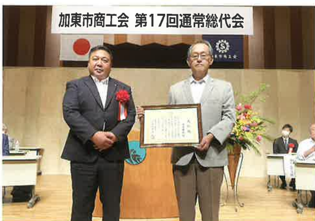
(左)永瀬県連副会長 (右)田尻理事